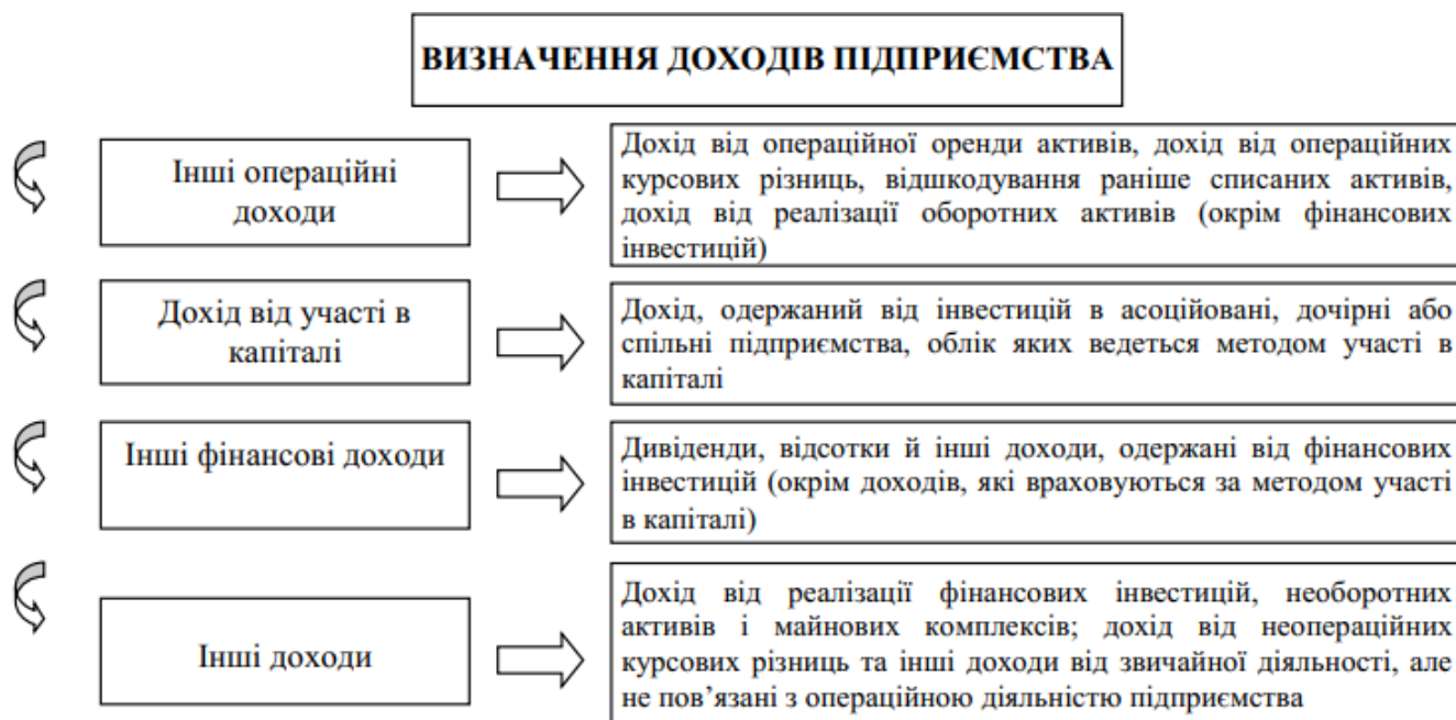
Рис. 5.1. Доходи підприємства

При цьому формування доходу від кожного виду діяльності має певні особливості (рис. 5.1).